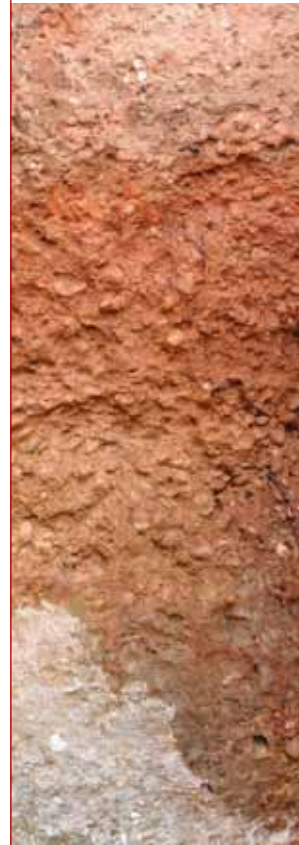
Graves sur marnes

Olivier jouit d'une variété de sols et de croupes étonnantes : juste ce qu'il convient de sols pauvres pour obliger la vigne à enfoncer ses racines, et de sols riches pour la nourrir. N'est-il pas prouvé que plus le sol est varié, plus le vin est riche en composants, et plus il est équilibré. Au sommet de ses deux croupes de 55 et 38 mètres, le château présente deux types de terrains graveleux : des graves meubles à matrice sableuse, et des graves compactes à matrice argilo-sableuse. Du sommet des pentes vers les coteaux, l'épaisseur des graves s'amenuise pour laisser apparaître des marnes argileuses, gréseuses, et des faluns miocènes. Plus bas encore, on rencontre du calcaire à astéries comme sur le plateau de Saint-Emilion. Le micro-climat exceptionnel qui y règne concourt également à ce que toutes les conditions optimales de production soient réunies.