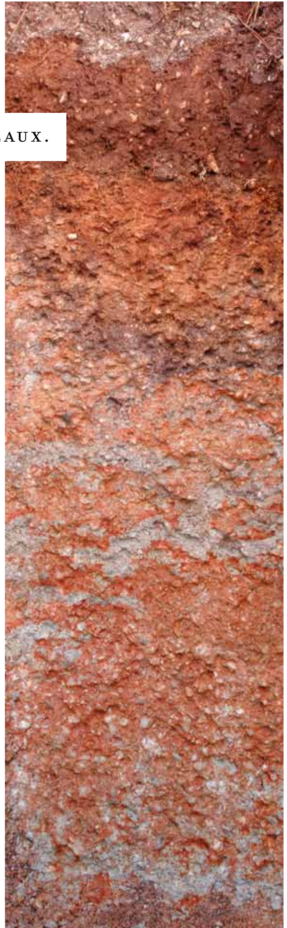
Graves compactes de Bel-Air